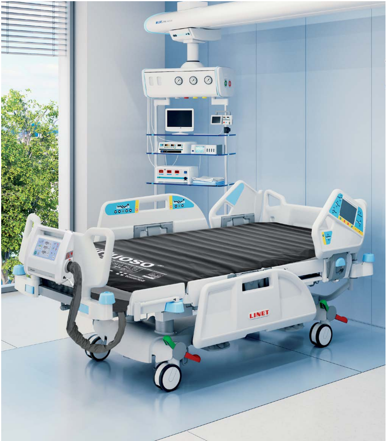
Cama para terapia intensiva