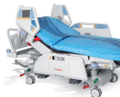
OptiCare com design integrado.