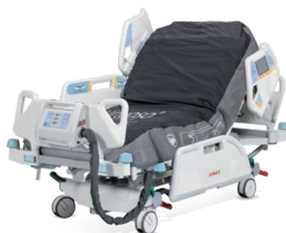
Virtuoso com pressão zero e tecnologia tricolor.

A arquitetura aberta da Multicare permite a utilização de diversos sistemas de colchões para prevenção ou recuperação de úlceras de pressão, de acordo com as necessidades de cada paciente.