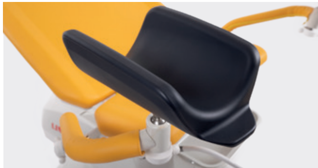
Apoios de pernas Goepel

A cadeira Graciella® tem vários apoios de pernas disponíveis que podem ser selecionados de acordo com o objetivo, foco e exames ginecológicos mais comuns de cada instalação de cuidados da saúde. Os apoios de pernas podem ser ajustados de acordo com as necessidades do paciente e do ginecologista.