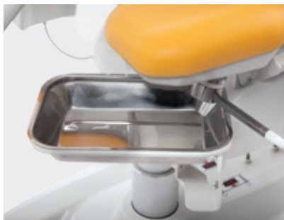
Recipiente em aço inoxidável