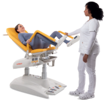
Posição de exame