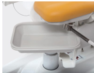
Recipiente de plástico