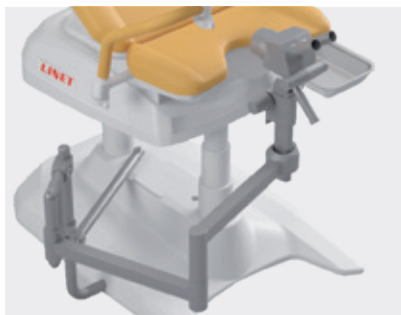
Suporte para coloscópio