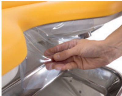
Proteção plástica na parte inferior da cadeira