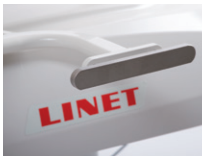
Suporte da barra EU