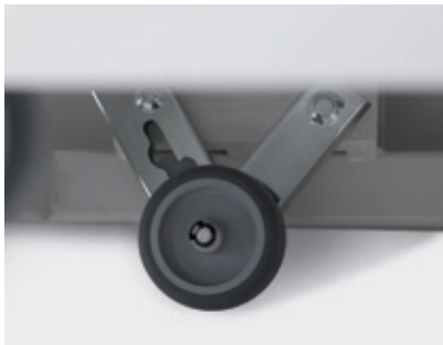
Rodas de manipulação