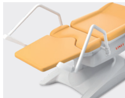
Placa das pernas