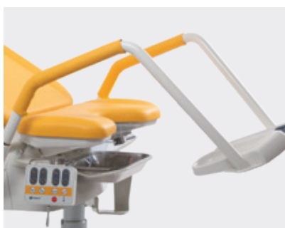
Apoios de pernas com estofado parcial