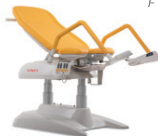
P – Laranja