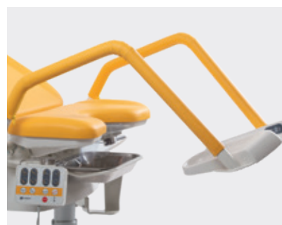
Apoios de pernas com estofado