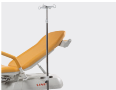
Suporte para infusão