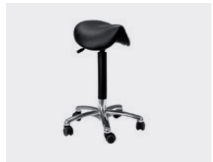
Cadeira do médico – ergonômica, altura ajustável, travamento manual