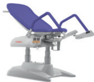
A – Violeta