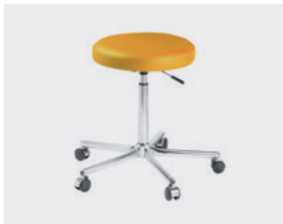
Cadeira do médico – altura ajustável, travamento manual