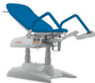
B – Azul brilhante