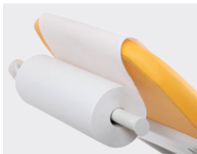
Suporte para rolo de papel (padrão)