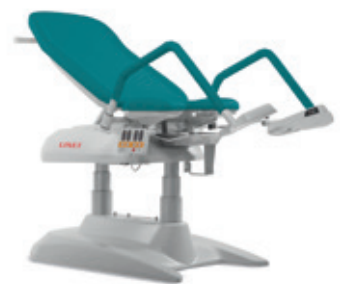
F – Verde água