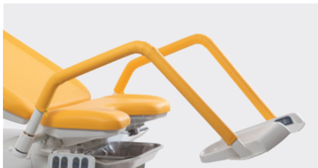
Apoios de pernas padrão